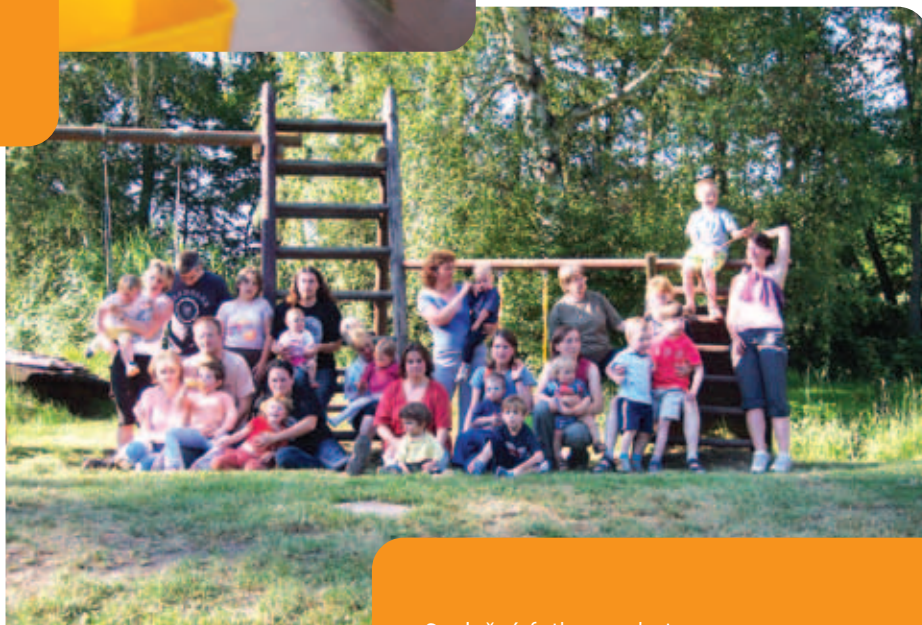
Společná fotka z pobytu

To, co člověka zachrání, je udělat krok... A pak další krok.