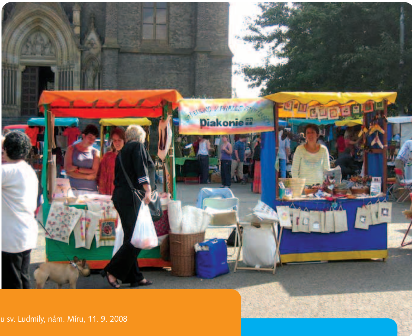
Trhy u sv. Ludmily, nám. Míru, 11. 9. 2008

"Učit se vědět, učit se dělat, učit se spolužití, učit se být."